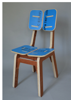
Chaise Bleue par KOZ architectes Fibois Île-de-France

Appels à projets « Design et Bois Français », sont organisés par Fibois Centre-Val de Loire, Fibois Auvergne-Rhône-Alpes, Fibois Ile-de-France et Fibois Bretagne. Le concours Bois & Design est organisé par Fibois Normandie. Le concours « Mobilier urbain en bois feuillu Seine-et-Marnais » est organisé par le CAUE 77.