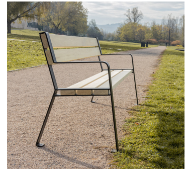
Le Forézien par TF URBAN Fibois Auvergne-Rhône-Alpes