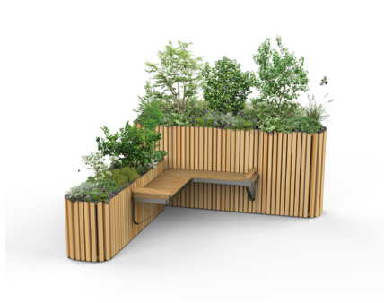
EDEN par Jérôme Boissière Design Studio Fibois Auvergne-Rhône-Alpes