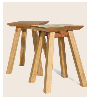
Hagi par Julie Baert, Studio JNOB Fibois Normandie