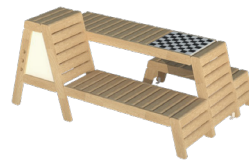
Équipe SPATIONEF CAUE 77