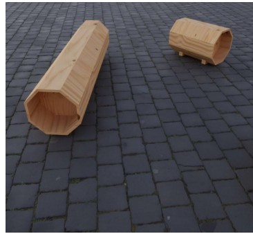
GRUME par Guillaume Thireau Fibois Bretagne