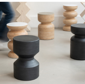
A-Serie par Maison Fifteen Fibois Auvergne-Rhône-Alpes