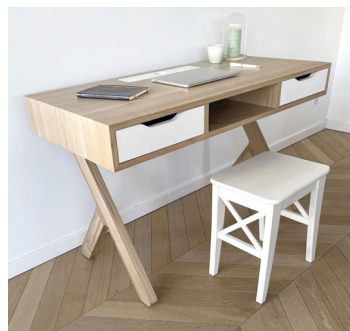
REMINI-SENS par Deschaumes Fibois Centre-Val de Loire