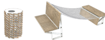
Équipe SI ARCHITECTES CAUE 77