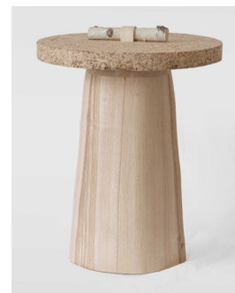
NOT WASTED par Cédric Breisacher Fibois Île-de-France