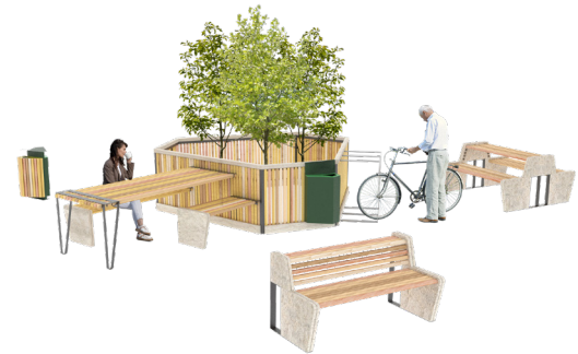
Équipe Songes et Jardins